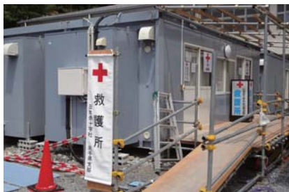
陸前高田第一中学校 救護所

「陸前高田」の真ん中でへき地医療を担ってきた岩手県立高田病院も、建物だけが寂しく廃墟となっていました。病院機能は近くのコミュニティセンターに集約し、院長先生をはじめスタッフの皆