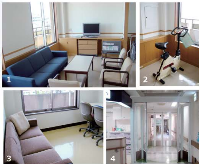
1. ゆったりと時間を過ごせるラウンジ 2. ラウンジにあるエアエアバイクで運動不足解消を 3. ご家族との面会が出来るように設置された面談室 4. ガラスで開放感のある二重扉

また、クリーンエリアのアメニティの充実を図るためにラウンジを設けました。病室を離れてテレビやDVDを