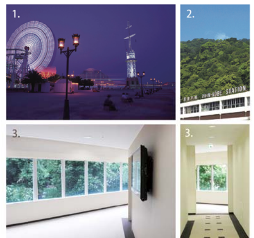
1. 異国情緒あふれる街並みに美しい夜景。六甲の緑を仰ぐ神戸で、観光がてら心身をリフレッシュしてはいかがでしょう。当クリニックも、北野の異人館、布引の滝、布引ハーブ園にもほど近く、散策にも好適なロケーションです。2. 新神戸の駅前、徒歩でわずか1分の好立地。新神戸まで神戸の中心・三宮から地下鉄で1駅2分。新幹線「のぞみ」で東京や福岡からは2時間台で、名古屋や広島からならば1時間台と、遠方からでもスムーズにアクセス可能です。3. 男女別の動線が気づかなく、六甲の緑を楽しみながら受診できます。

神鋼病院は1915年開設以来、あたたかい医療、より良い医療を提供し続けてまいりました。特に女性の方には、乳腺科、婦人腫瘍科をはじめ、高い評価を受けており、安心できる医療を提供しております。