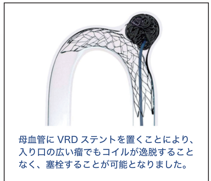
図1 VRD（コイル塞栓術支援用ステント）

母血管にVRDステントを置くことにより、入り口の広い瘤でもコイルが逸脱することなく、塞栓することが可能となりました。