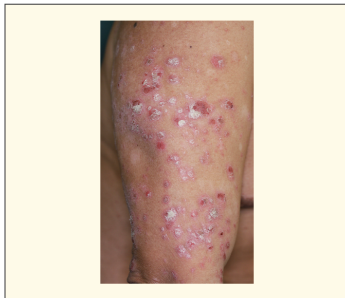
図1 尋常性(局面型)乾癬

されたアプレミラストも乾癬治療の進歩を語る上で外せない薬剤です。この薬剤は、炎症を引き起こす物質の産生にかかわっているホスホジエステラーゼ4 (PDE4) の働きを抑え、炎症反応を抑制します。臨床試験成績では生物学的製剤ほど有効性は高くありませんが、個疹が小さいなど症例を選べば高い有効性を示す印象があります。この薬剤は、免疫抑制作用を有さないため重篤な副作用も少なく、生物学的製剤が使用できない患者さんにも投与可能であり、貴重な治療選択肢の1つとなっています。